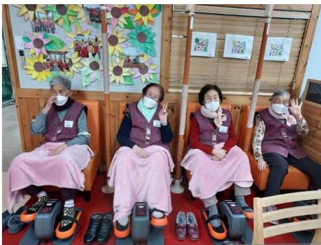
어르신들 열심히 운동하고 계십니다.