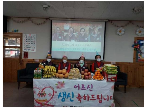
생신잔치에 어르신들 너무 행복해보이세요. ~~ 건강하게 오래오래 저희곁에 계셔주세요 ^^