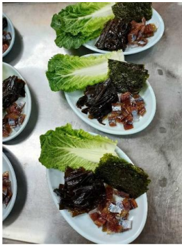
어르신들께서 과메기를 맛있게 드셨어요.~~