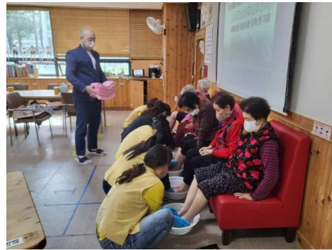
5/8 어버이날 세족식