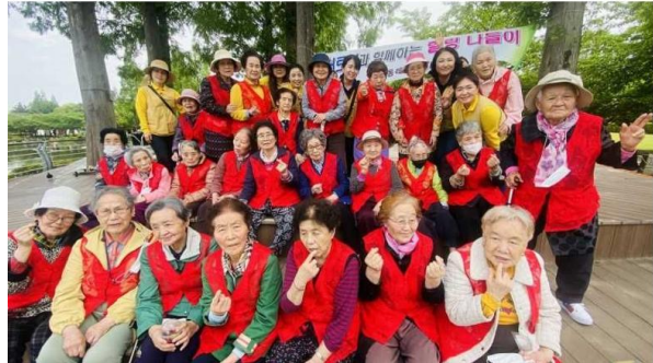
5/12 김해연지공원으로 봄소풍