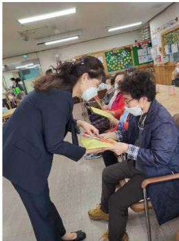
5/8 어버이날 선물증정