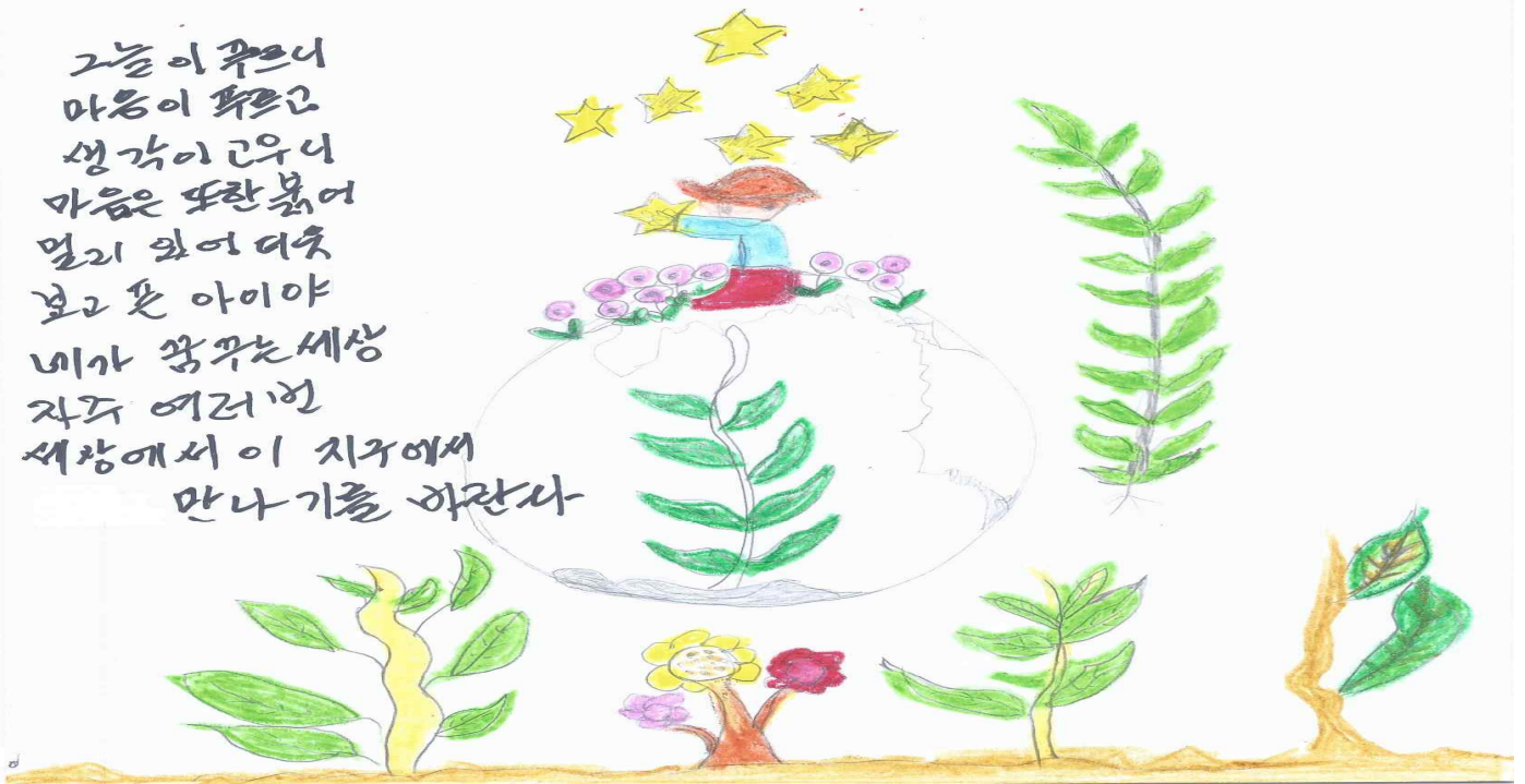
[작품 참조 : 동래데이케어 주간보호센터 이○○ 어르신]

그늘이 푸르니 마음이 푸르고 생각이 깊으니 마음은 또한 붉어 멀리 와어 더욱 보고픈 아이야 네가 꿈꾸는 세상 자주 여러 번 세상에서 이 지구에서 만나기를 하란사